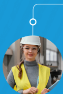
Responsable de boutique