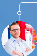
Responsable de département ou de secteur