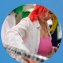
Animateur-trice de rayon