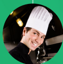
Chef-fe de rang