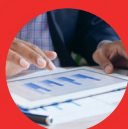
Animateur-trice de Formation