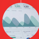
Chargé-e de Formation